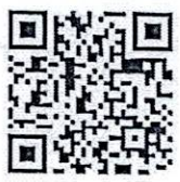
เอกสารแนบ