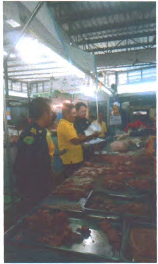
วันที่ ๑๙ มิถุนายน ๒๕๖๒ ตลาดสดสิทธิธรรม (ตลาดหนองบัว)