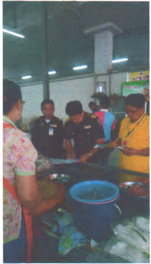
วันที่ ๑๘ มิถุนายน ๒๕๖๒ ตลาดสดเทศบาล ๕