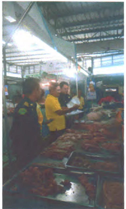
วันที่ ๑๙ มิถุนายน ๒๕๖๒ ตลาดสดสิทธิธรรม (ตลาดหนองบัว)