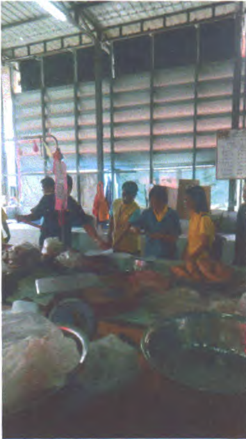
วันที่ ๑๘ มิถุนายน ๒๕๖๒ ตลาดสดเทศบาล ๓ (ตลาดใหญ่)