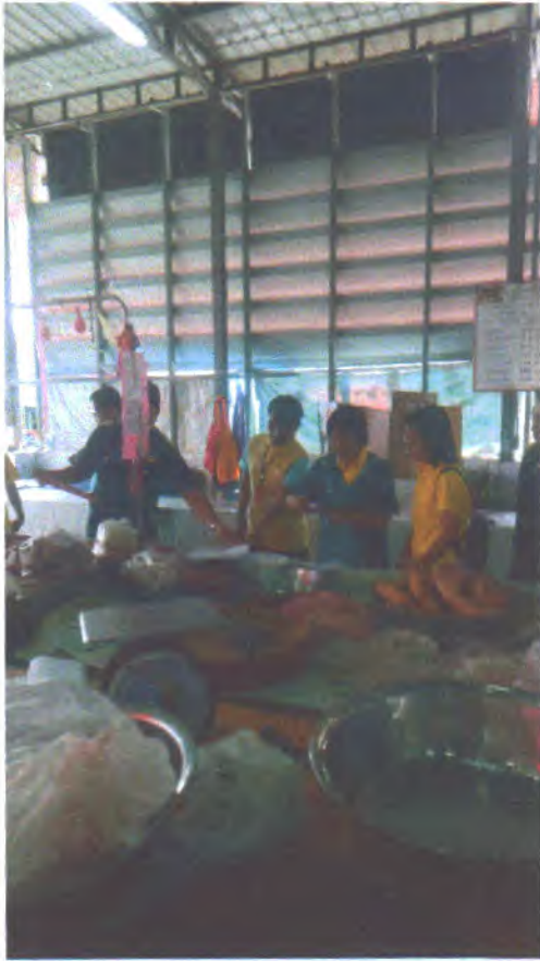
วันที่ ๑๘ มิถุนายน ๒๕๖๒ ตลาดสดเทศบาล ๓ (ตลาดใหญ่)