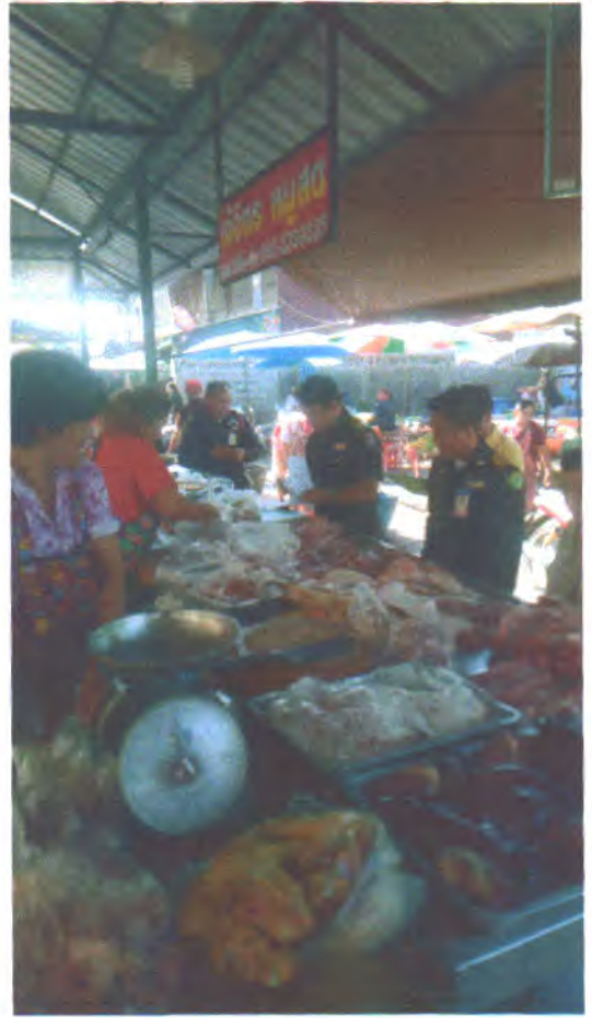
วันที่ ๒๐ มิถุนายน ๒๕๖๒ ตลาดท่าวังหิน