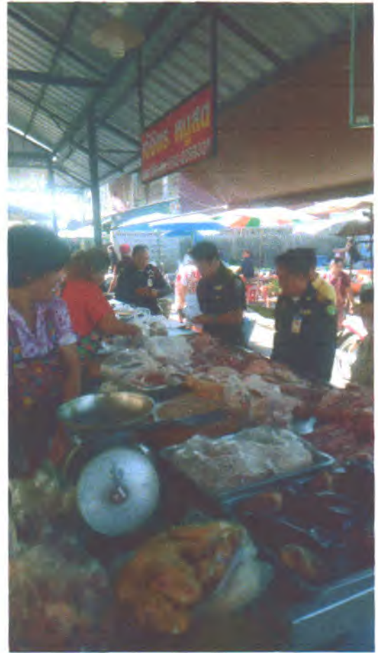
วันที่ ๒๐ มิถุนายน ๒๕๖๒ ตลาดท่าวังหิน