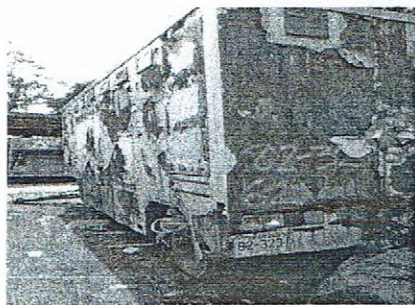
รถสุขาเคลื่อนที่ ทะเบียน 82-3231