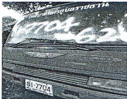
รถบรรทุกขยะมูลฝอย ทะเบียน ๘๑-๗๗๐๔