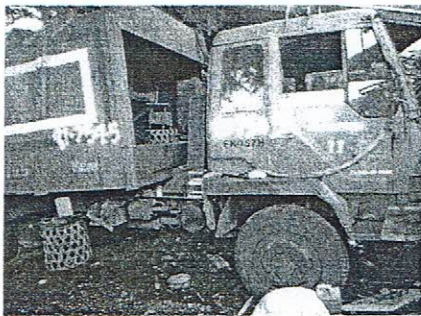
รถบรรทุกขยะมูลฝอย ทะเบียน 81-2707