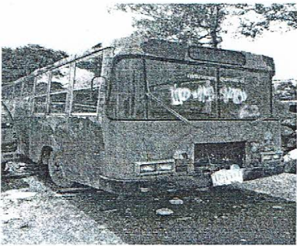
รถสุขาเคลื่อนที่(ไม่มีทะเบียน)