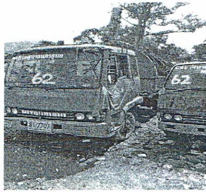
รถบรรทุกขยะมูลฝอย ทะเบียน 81-2707