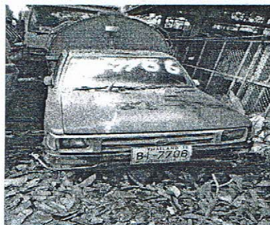
รถบรรทุกขยะมูลฝอย ทะเบียน ๘๑-๗๗๐๖