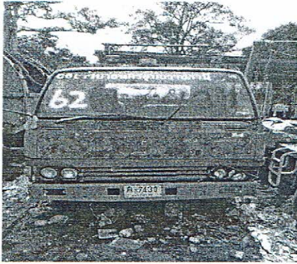
รถบรรทุกขยะ ทะเบียน ผ-๗๔๓๘