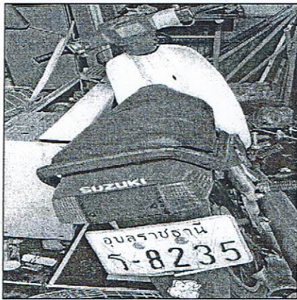
รถจักรยานยนต์ ร-๘๒๓๕ , กล -๘๕๒