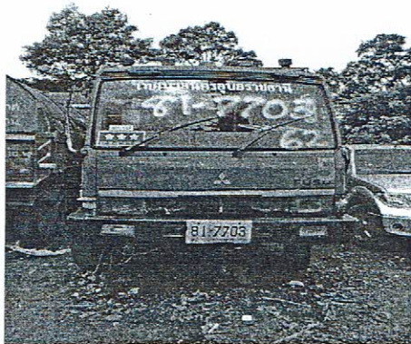
รถบรรทุกขยะมูลฝอย ทะเบียน ๘๑-๗๗๐๓